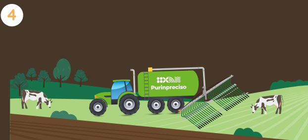
4 Realización de pruebas durante la fertilización.