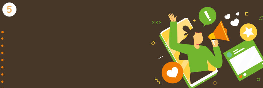
5 Durante todo el proyecto: ejecución del plan de divulgación.