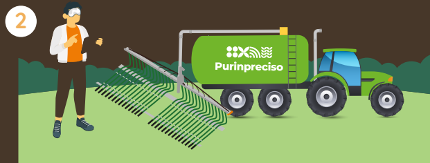
2 Diseño, montaje y calibración del equipo de análisis y control.