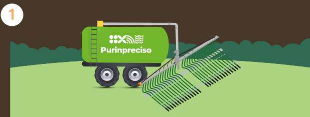
1 Adaptación del tanque distribuidor de purín para la instalación del sistema.

Sistema inteligente de control y documentación digital de equipos de aplicación de purines para la optimización de su uso como fertilizantes